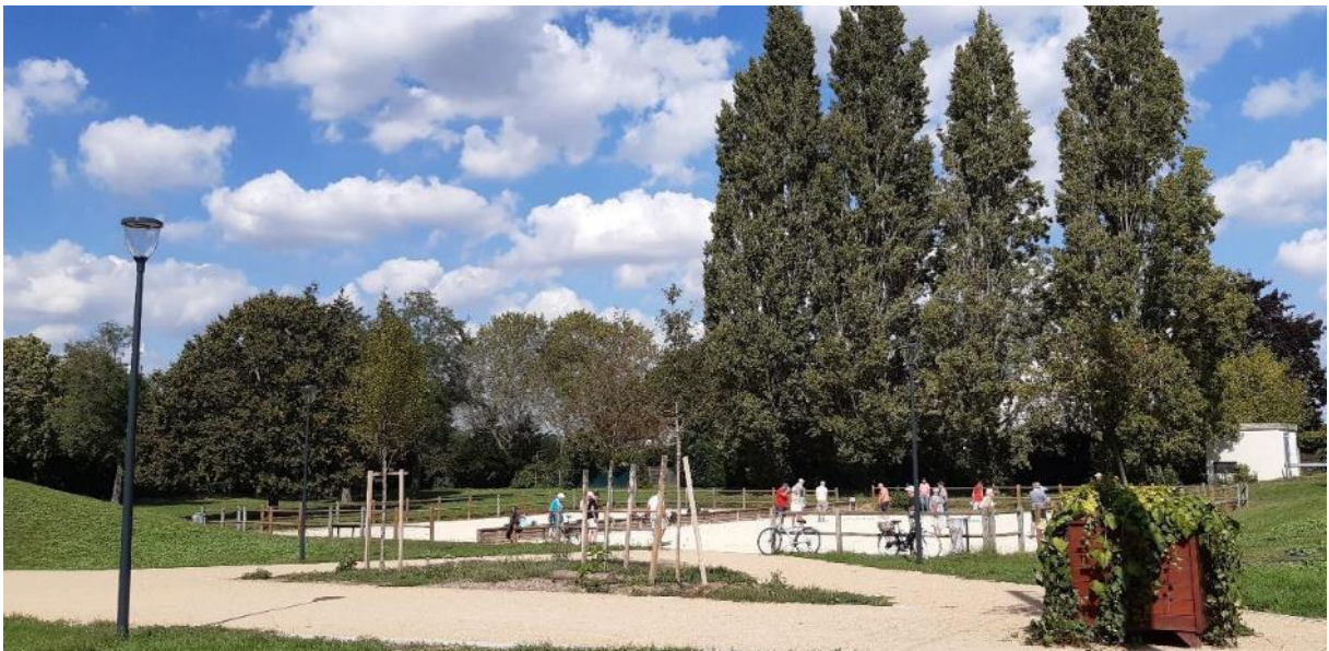
De beaux arbres à préserver Conflans Sainte Honorine ! (Rue de la Justice – quartier Chennevières)