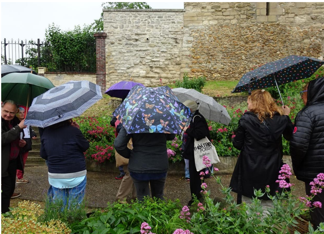
Le « Jardin des parapluies », dimanche 10 mai 2026 ☺